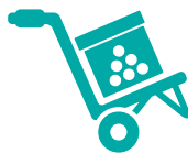
Fogyóeszközök folyamatos biztosítása