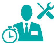
Helyszíni mérnöki segítség