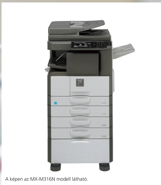
A képen az MX-M316N modell látható.

RUGALMAS KIALAKÍTÁSÚ HÁLÓZAT- KÉSZ A3-AS FEKETE-FEHÉR MFP