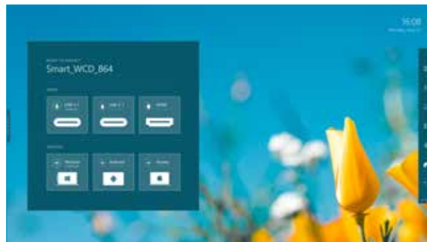
A kép csak illusztráció.

Akár öt* eszköz is csatlakoztatható egyszerre és a Touch Back vezérlés lehetővé teszi a képernyő tartalmának meghatározását akár a képernyőről, akár a forráseszköztől. Így ideális munkacsoportok dinamikus megbeszéléseihez vagy interaktív képzésekhez, hiszen növeli a munka hatékonyságát, ösztönzi az aktív részvételt és hatékonyabb tanulási módot biztosít.